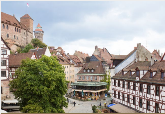
Immobilie vor Ort