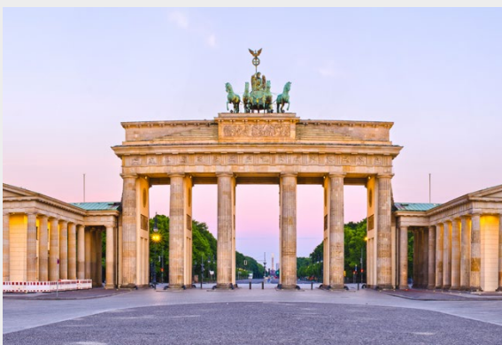
Immobilie in Berlin