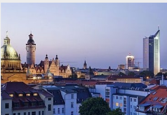
Immobilie in dt. Metropolen (z. B. Leipzig)