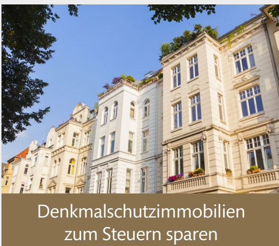
Denkmalschutzimmobilien zum Steuern sparen